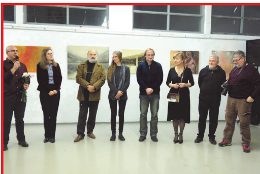
Прешерново оро, декември 2018