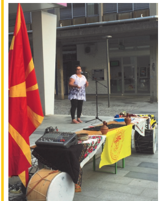
Branje recitalov in poezije 28.05.2018 Teden likovne in pesniške razigranosti

V so organizaciji z učenci dopolnilnega pouka makedonske šole je v Novi Gorici potekal dogodek podelitev spričeval za šolsko leto 2017/2018 .