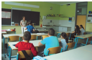
Одржување настава во Козина Хрпелје