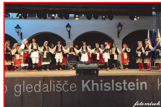
ФА Китка Истибања на 20. Етно фолк