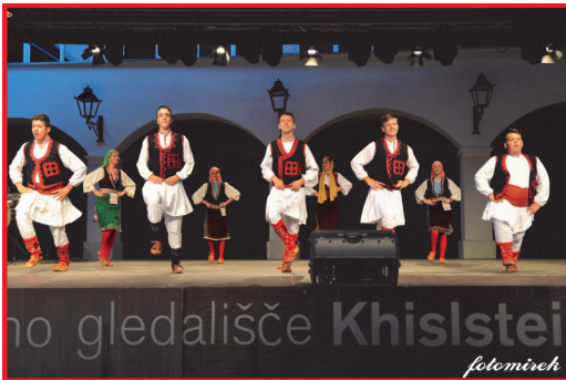
Настап на младинската група на друштвото на 20. Етно фолк

година беше домаќин на три големи ансамбли од Македонија: Ансамблот Танец од Скопје, кој на 26. мај одржа концерт во салата Примсково, со што ги затворивме 26. денови на Св. Кирил и Методиј, фолклорниот ансамбл Китка од Истибања, кој учествуваше на 20. Етно фолк во Крањ и фолклорниот ансамбл Љупчо Сантов од Оризари, кој настапи на вториот дел од Прешерново оро.