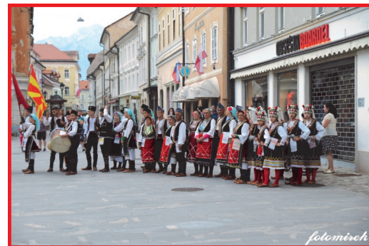
ФА Китка од Истибања на дефилето пред почетокот на 20. Етно фолк

Охридски бисери од Нова Горица, МКД Илинден од Јесенице, МКД Кочо Рацин од Копер, КД Брдо од Крањ, СКПД Свети Сава од Крањ, Меѓумурско фолклорно друштво Љубљана од Љубљана, ФГ Предвор од Предвор и специјалните гости од Македонија, ФА Китка од Истибања.