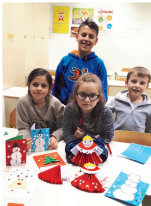
Одржување настава во Љубљана