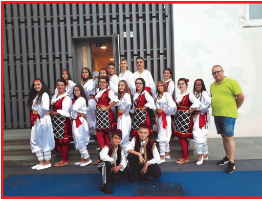
Настап кај КУД Бехар