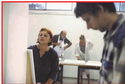
6. ликовна колонија во организација на МКД Св. Кирил и Методиј