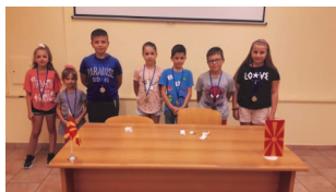
Натпревар во знаење

Со гордост можеме да кажеме дека секоја година се зголемува бројот на нашите активности и успешно реализирани проекти.