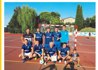
Osvojitev prvega mesta na nogometnem turnirju v Kopru

Društvo se posveča negovanju makedonske kulturne tradicije. To dosega s prirejanjem razstav in športnih aktivnosti, ter predvsem z zelo aktivno folklorno sekcijo, ki se ukvarja s tradicionalnimi plesi, pesmi in glasbo. V okviru društva delujejo tri folklorne skupine (otročka, mladinska in veteranska), ter Etno glasbena skupina, ki izvaja glasbo s tradicionalnimi makedonskimi inštrumenti.