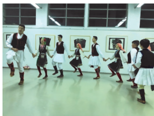
Младинска ФГ, Прешерново оро, февруари 2018

На 17. јуни во Летниот театар Khislstein го организиравме јубилејниот 20. по ред Етно фолк.