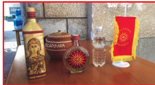
Makedonsko Sonce 4 pod arkadami MONG 09.09.2018