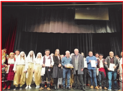
Celoletni koncert društva MKD Ilinden Jesenice

Makedonsko kulturno društvo »Ilinden« Jesenice je bilo ustanovljeno leta 1993 in šteje 120 članov in članic. Društvo se posveča negovanju makedonske kulturne tradicije. To dosega s prirejanjem razstav in športnih aktivnosti, ter predvsem z zelo aktivno folklorno sekcijo, ki se ukvarja s tradicionalnimi plesi, pesmi in glasbo. V okviru društva delujejo tri folklorne skupine (otročka, mladinska in veteranska), ter Etno glasbena skupina, ki izvaja glasbo s tradicionalnimi makedonskimi inštrumenti. Vse štiri skupine redno gostujejo po celi Sloveniji in letno izvedejo od deset do petnajst nastopov. Društvo tudi pogosto sodeluje z ostalimi društvi iz Slovenije, Hrvaške, Makedonije, Bolgarije in Avstrije. Naša najbolj uspešna folklorna skupina je mladinska, ta je nastopala v raznoraznih državah. Njihov uspeh jih je celo popeljal v A grupo folklornih skupin iz Slovenije. Praznovanje obletnice 25 let društva smo izvedli v treh delih, prvega smo praznovali v mesecu maju, takrat smo priredili koncert, kjer smo povabili društva iz Slovenije, drugi del smo praznovali avgusta, na dan državnega, kulturnega in verskega praznika »Ilinden«, tretji del