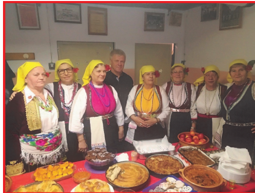
Predstavitve makedonske kulinarike

pa je bil celoletni koncert našega društva, kateri pa je bil novembra.