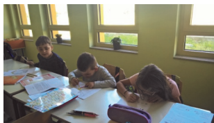
Одржување настава во Ајдовщина