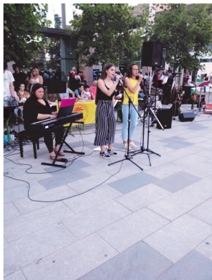
Prepevanje pesmi moderne glasbe 30.05.2018 Teden likovne in pesniške razigranosti

V veliko čast nam je bilo, da smo gostili folklorni ansambel Kitka iz Istibanje Makedonija in pri tem uživali v njihovi izvedbi tradicionalnih makedonskih plesov.