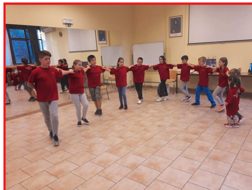
Една од првите проби на најмладите членови

Македонското културно друштво „Кочо Рацин“, Обала - Копер претставува симбол на македонскиот фолклор, традиција и култура повеќе од дваесет и пет години, културен амбасадор кој несебично ја презентира и споделува богатата македонска традиција во Словенија и во светот. Нашето друштво создаде мостови меѓу народите и културите, и стекна бројни