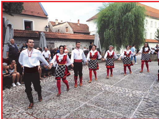
Дефиле по стариот дел на Крањ, непосредно пред Етно фолк фестивалот

пријатели во Република Словенија и во странство. Со гордост можеме да кажеме дека секоја година се зголемува бројот на нашите активности и успешно реализирани проекти. Во јануари годинава, покрај младинската, за прв пат беше формирана и детска фолклорна група, која неуморно работи приближно една година. Нашите најмлади членови веќе можат да се пофалат со неколку успешни настапи на различни манифестации и фестивали.