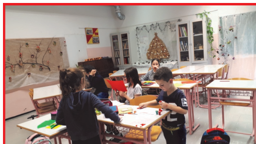
Одржување на настава во Дивача

Целта на наставата по македонски јазик за децата на нашите иселеници во странство е да се развива чувство на припадност кон својата култура и јазик и почит кон другите култури, да се негува македонскиот стандарден идентитет и да се оспособат за усна и писмена комуникација на македонски стандарден јазик. Внатрешната корелација со содржини од: запознавање на околината на родниот крај, општество, географија, историја, музичко образование и ликовно образование е во насока да стекнат трајни и употребливи знаења и вештини притоа изразувајќи се креативно. Оваа настава е во насока да се сочува македонската традиција и култура, сопствениот национален идентитет, мултикултурниот соживот и толеранцијата преку одржување на врските со татковината и родниот крај. Програмата е структурирана во три периоди со посебно дефинирани цели за секој период.