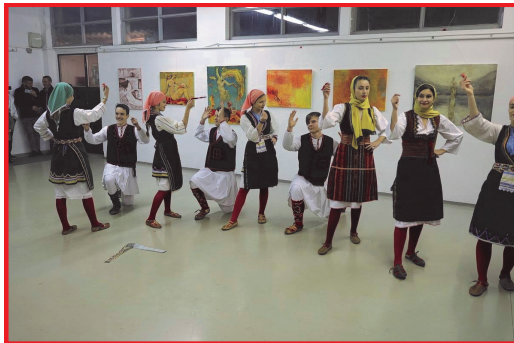
Младинска фолклорна група

изборна за нашето друштво. Покрај новите органи, друштвото доби и нов претседател.