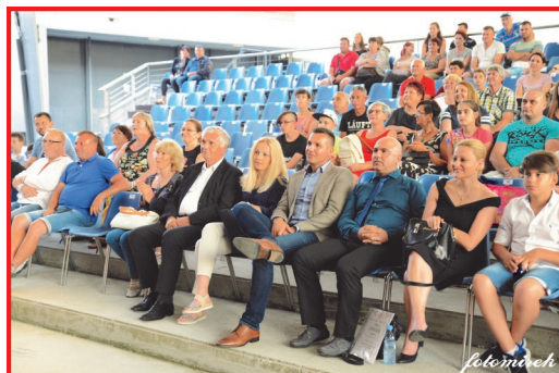
20. Етно фолк

Во 2018 година фолклорната секција беше исто така многу активна. На 17. јуни во Летниот театар Khislstein го организиравме јубилејниот 20. по ред Етно фолк. Фестивалот го изведовме во два дела, дефиле на фолклорните групи низ стариот дел на Крањ и концерт на фолклорните групи на бината во Летниот театар Khislstein. На фестивалот учествуваа МКД Св. Кирил и Методиј од Крањ, МКД