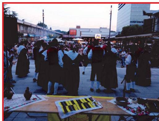
Nastop slovenskih, italijanskih folklornih skupin 30.05.2018 Teden likovne in pesniške razigranosti

Novembra 2017 je društvo pripravilo projekt dramsko folklorna prireditev z