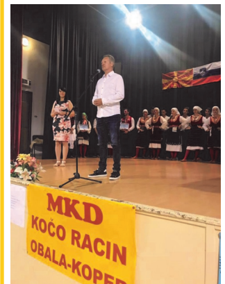
Денови на македонската култура

Македонското општество и нашиот народ со право може да се гордее со една богата култура, која е создавана со векови и постојано се надградува и се пренесува од генерација на генерација. Традицијата е оној елемент кој грижливо се негува, одржува и опстојува во сите времиња. Најчесто повозрасните се држат до традицијата и ја пренесуваат од колено на колено.