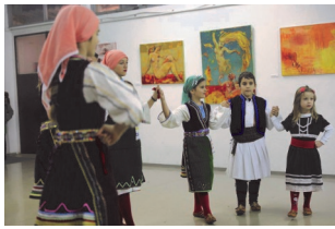
Детска фолклорна група