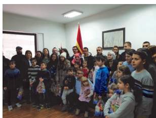
Во Амбасадата на Република Македонија во Љубљана