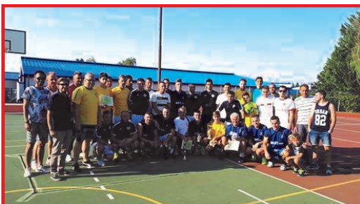
Турнир во мал фудбал 2018