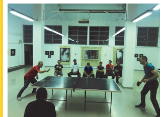
Турнир во пинг понг