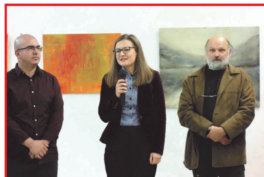
Прешерново оро, декември 2018

Делата, коишто ги насликаа основношколците кои учествуваа на 2. ликовна колонија за деца беа изложени во галеријата Бала во Крањ.