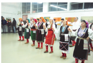
Ветеранска фолклорна група