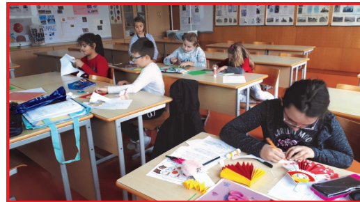
Одржување настава во Копер

Наставата се реализира по годишна програма на дополнителна настава на мајчин јазик и културното наследство на Република Македонија за