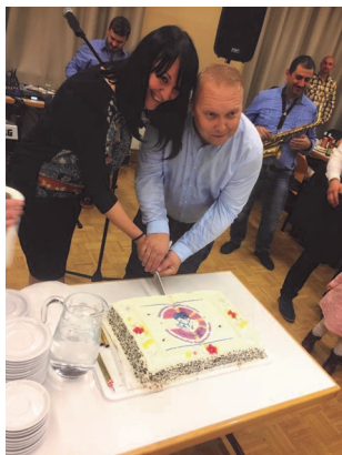
МКД Тодор Тоше Проески - Австрија

Со гордост можеме да кажеме дека секоја година се зголемува бројот на нашите активности и успешно реализирани проекти.