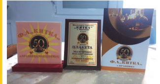
Учество на фестивалот организиран од ФА Китка, Република Македонија

Сите овие работи ја потврдуваат тезата дека ние си ја чуваме и негуваме нашата традиција, а тоа е добро, посебно желбата на младите да го превземаат и пренесуваат тоа, бидејќи така опстанува еден народ и тоа ни покажува од каде сме и кои сме.