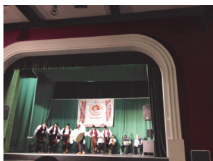
Ансамбл Танец Скопје