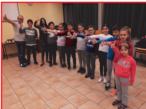
Детската фолклорна група

Секој народ, секое општество си има свои обележја, карактеристики и специфични елементи, како дел од сопствената култура, по кои тој се препознава и разликува од останатите народи и општества. Македонското општество и нашиот народ со право може да се гордее со една богата култура, која е создавана со векови и постојано се надградува и се пренесува од генерација на генерација. Традицијата е оној елемент кој грижливо се негува, одржува и опстојува во сите времиња. Најчесто повозрасните се држат до традицијата и ја пренесуваат од колено на колено. Традицијата во нашето општество, пред сè, се