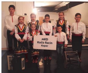
Настап во Изола