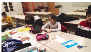
Одржување настава во Крањ