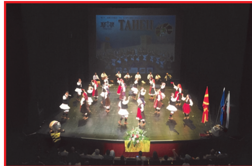
Celovečerni koncert Tanec 27.05.2018

vilne nagrade in priznanja. Tanec je sodeloval na več kot 5500 koncertih doma in v tujini, pred več kot 8 milijonskim občinstvom. Za svojo kulturno misijo ustvarjajo stike z makedonsko migracijo po svetu in konstantno pomagajo pri ohranjanju makedonske kulturne tradicije. Saj tradicija in folklor predstavljata najbolj hranjeno skrivnost, luč, ki nas pelje skozi tunel časa. Z eno besedo Tanec predstavlja premično enciklopedijo makedonskega ljudstva. Velika čast je doletela našo folklorno skupino saj je nastopila kot predskupina in pri tem požela pohvale tako občinstva kot tudi nacionalnega ansambla za odlično izveden nastop.