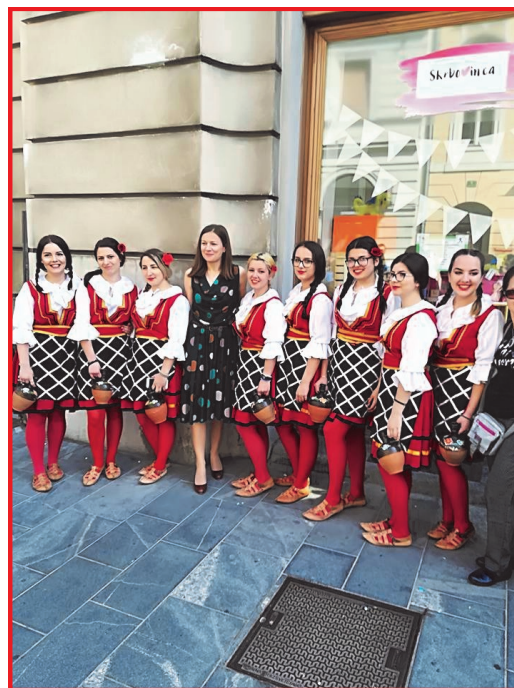
Настап во Љубљана

Наш најзначаен и најголем проект е „Денови на македонската култура“, кој традиционално го изведуваме секоја година во септември, во знак на одбележување на денот на независноста на Република Македонија. Секогаш започнуваме со турнир во мал фудбал, по кој следат низа други активности во текот на неделата, за на крајот да го заклучиме со прекрасна фолклорна вечер. Турнирот во мал фудбал го организираат членовите на нашата фудбалска секција која дејствува во рамките на нашето друштво. На турнирот, кој се одража во ОУ „Антон Укмар“ во Копер, учествуваа десет