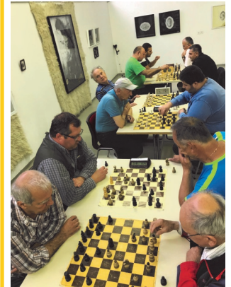
Турнир во брзо потезен шах

И како што рековме во воведот на овој прилог, 2018 година беше