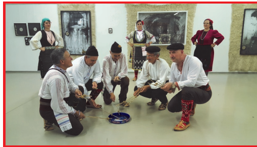
Ветеранска ФГ, промоција на нови кореографии