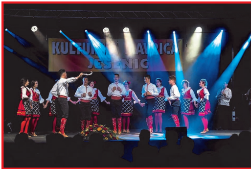
Настап во Јесенице

Секој народ, секое општество си има свои обележја, карактеристики и специфични елементи, како дел од сопствената култура, по кои тој се препознава и разликува од останатите народи и општества. Македонското општество и нашиот народ со право може да се гордее со една богата култура, која е создавана со векови и постојано се надградува и се пренесува од генерација на генерација. Традицијата е оној елемент кој грижливо се негува, одржува и опстојува во сите времиња. Најчесто повозрасните се држат до традицијата и ја пренесуваат од колено на колено. Традицијата во нашето општество, пред сè, се