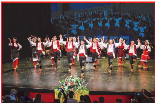
Nastop folklorne MKD Ohridski biseri kot predskupina na celovečernem koncertu Tanec

Med 27. in 31. majem je v središču mesta Nove Gorice potekal »Teden likovne in pesniške ustvarjalnosti«. Otvoritev dogodka je pripadal makedonskemu Narodnemu ansamblu za ljudske igre in pesmi »Tanec« iz Skopja. Tanec predstavlja simbol makedonske folklorne tradicije in folklorne že 7 desetletij, ambasador kulture, ki nesebično predvaja in deli bogato makedonsko tradicijo v domovini in svetu. Za uspeh Tanca govorijo šte-